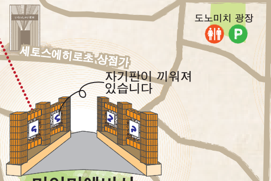
미야마에바시 세토사에히로초 상점가 자기판이 끼워져 있습니다