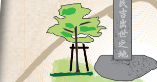
지소 가토 다미키치 출생지