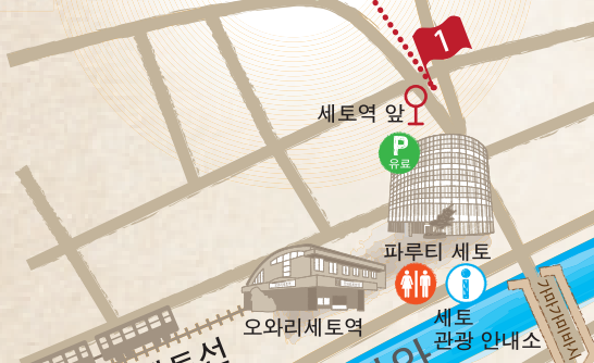
세토역 앞 파루티 세토 오와리세토역 세토 관광 안내소