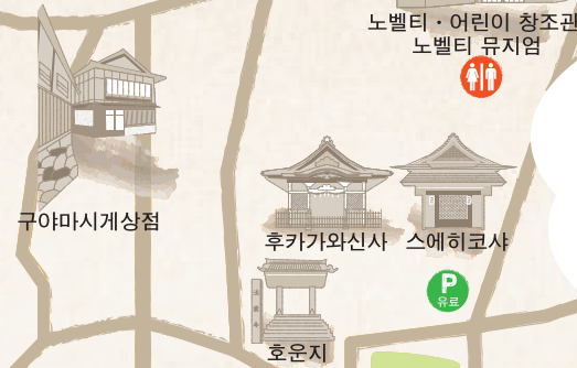
구야마시계상점 후카가와신사 스에히코사 호운지 노벨티·어린이 창조관 노벨티 뮤지엄