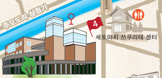
세토구라 (2F 세토구라 뮤지엄) 세토마치 쓰쿠리테 센터