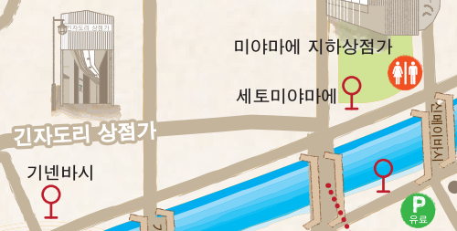
미야마에 지하상점가 세토미야마에