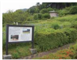
佐佐市瀨血山窯遺址 （長崎縣指定歷史遺址）