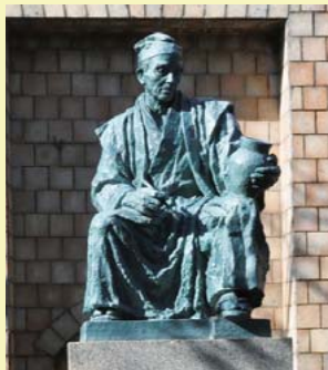
加藤民吉像 （窯神神社內）